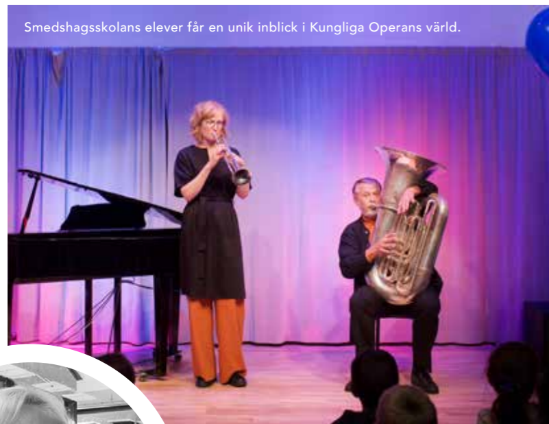
Smedshagsskolans elever får en unik inblick i Kungliga Operans värld.