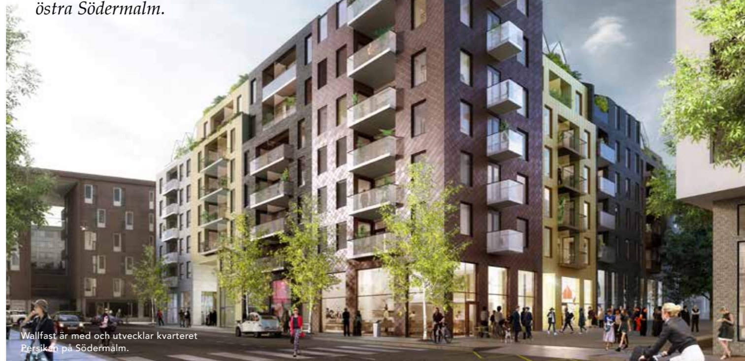
Wallfast är med och utvecklar kvarteret Persikan på Södermalm.

Byggstart hösten 2019. Wallfast bygger omkring 120 hyreslägenheter i kvarteret Persikan på östra Södermalm.