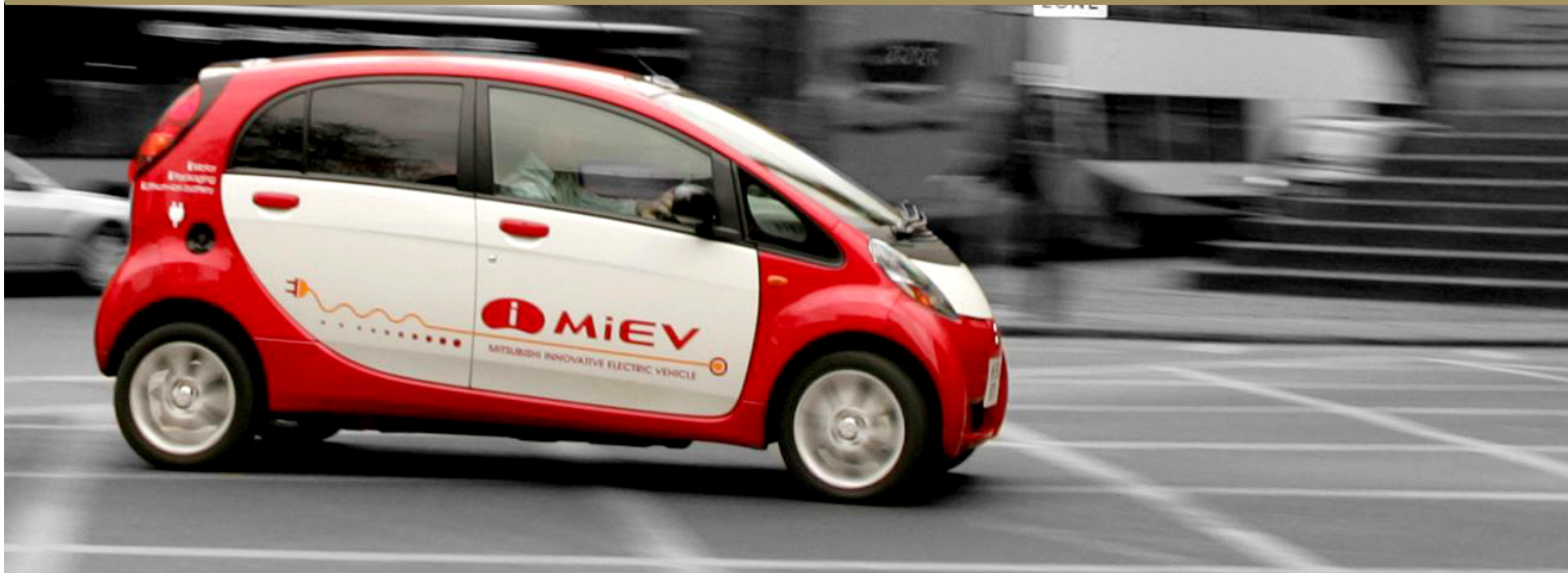
Wallfasts nya el-bilar är av märket Mitsubishi i-MiEV (Mitsubishi innovative Electric Vehicle).

Mars 2011 | Information från din förvaltare