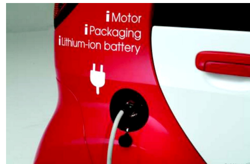
För att ladda bilen ansluter man kontakten i laddningsstationen.

Två laddningsstationer finns nu på Wallfasts huvudkontor och på ytterligare två platser inom förvaltningen. Elbilen ger inga avgaser vid körning. Motorn är 2-5 gånger mer effektiv än bensin- och dieselmotorer och vi använder "grön elektricitet", som vatten-, vindkraft och el från solceller, för att ladda bilen. Alla dessa fördelar har gjort att Wallfast ser elbil som ett självklart val!