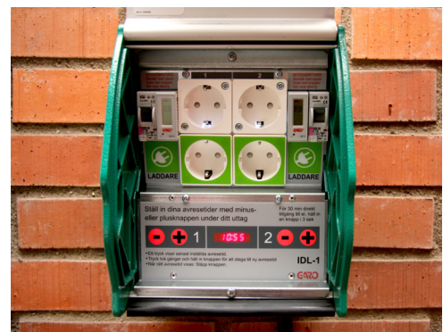
Laddningsstation till elbil.